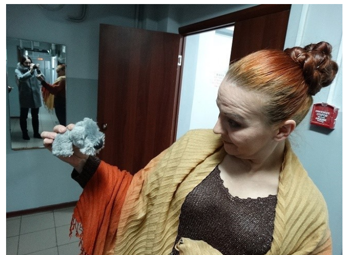
Перед Шуриком не устоит даже актриса!

Текст: Анна Баранова Газета «Единичка», г. Фурманов