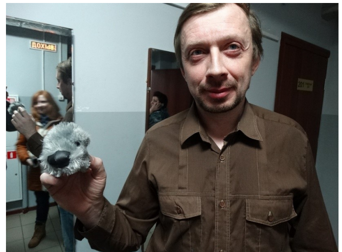
Шурик с Шуриком